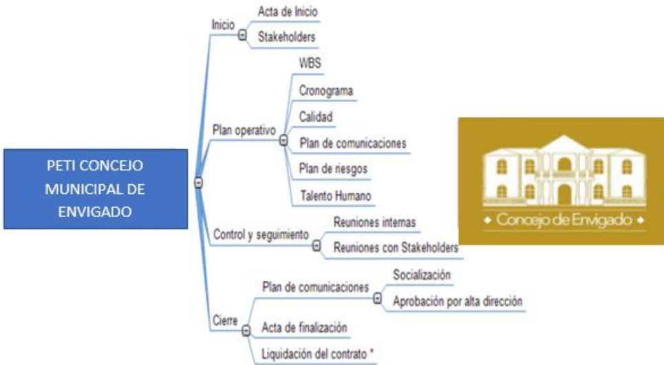
Figura 4. Proyecto PETI Concejo Municipal de Envigado

En esta primera actividad el equipo designa una serie de tareas y realiza el levantamiento de los procesos tendientes a lograr los objetivos trazados para la construcción del PETI, los cuales se presentan a continuación: