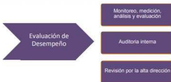
Figura 5 - Fase de Evaluación de desempeño 3

El proceso de seguimiento y monitoreo del MSPI se hace con base a los resultados que arrojan los indicadores de la seguridad de la información propuestos para verificación de la efectividad, la eficiencia y la eficacia de las acciones implementadas.