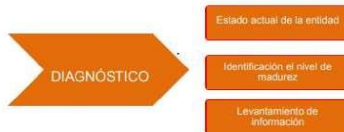
Figura 2 – Etapas previas a la implementación

En esta fase se pretende identificar el estado actual de la organización con respecto a los requerimientos del Modelo de Seguridad y Privacidad de la Información.