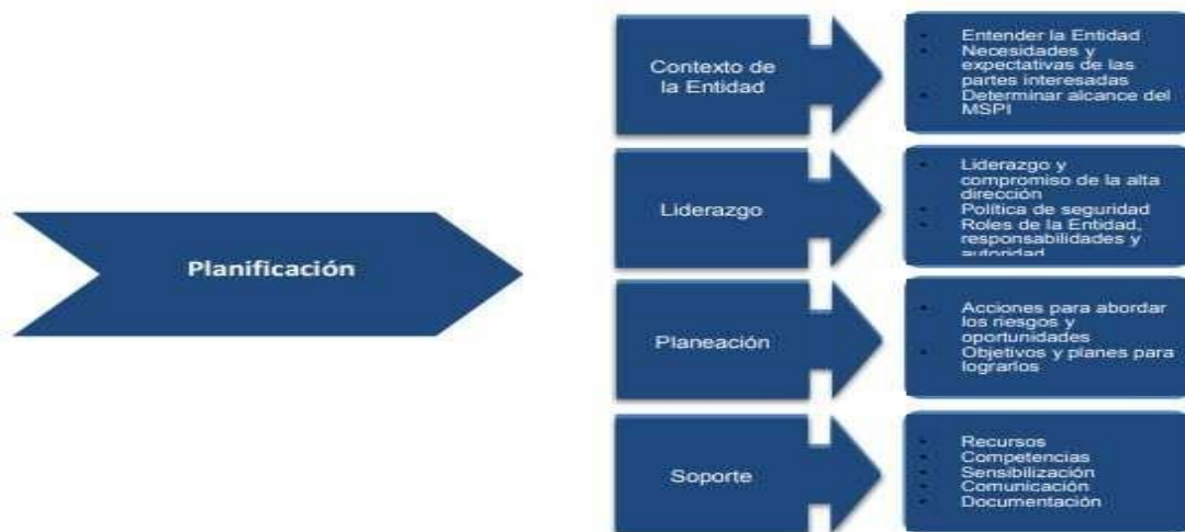
Figura 3 - Fase de planificación 1

Para desarrollar el alcance y los límites del Modelo se deben tener en cuenta las siguientes recomendaciones: Procesos que impactan directamente la consecución de objetivos misionales, procesos, servicios, sistemas de información, ubicaciones físicas, terceros relacionados, e interrelaciones del Modelo con otros procesos.