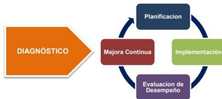
Figura 1 – Ciclo de operación del Modelo de Seguridad y Privacidad de la Información