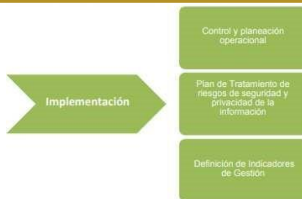
Figura 4 - Fase de implementación 2